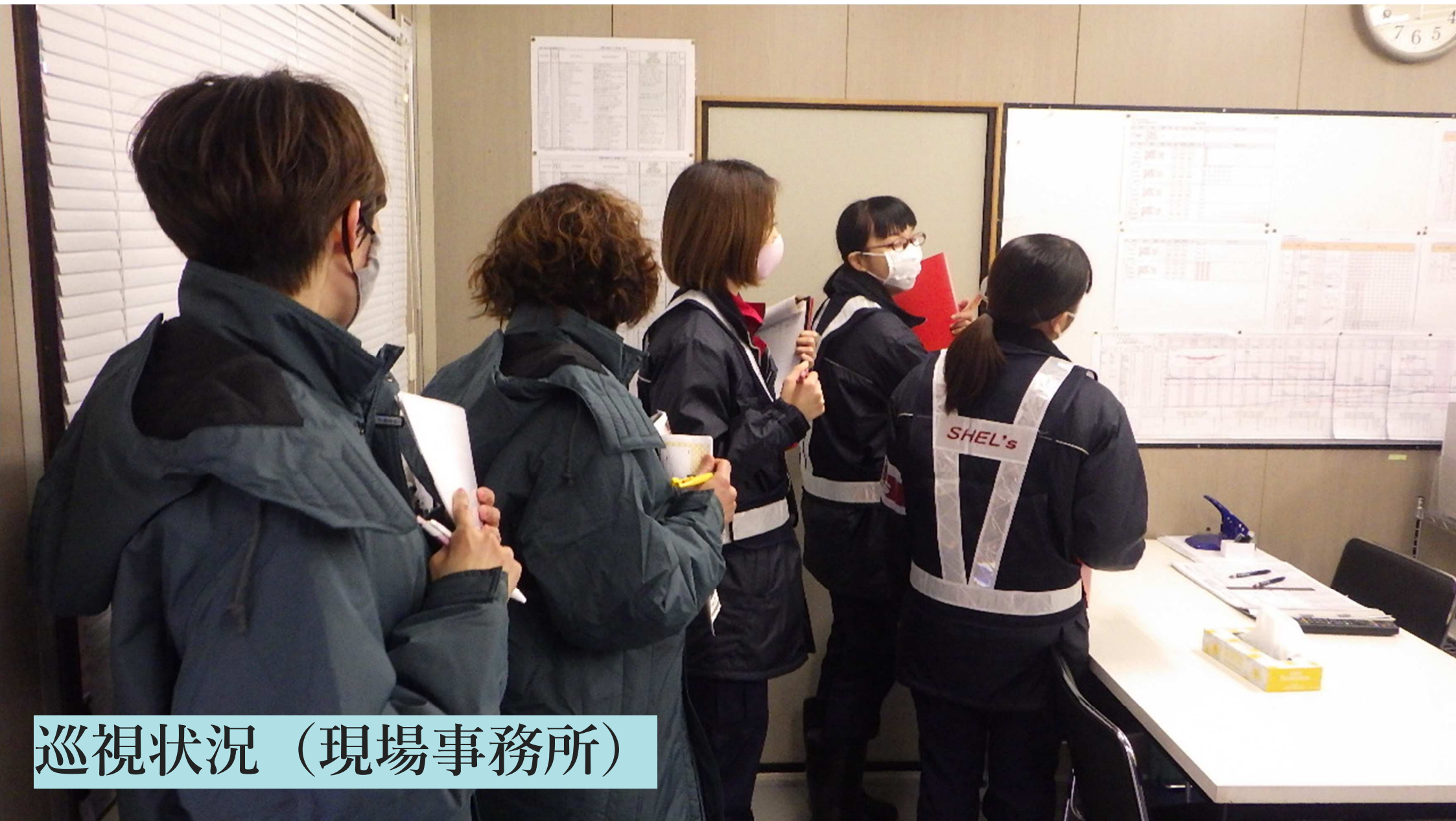
巡視状況（現場事務所）